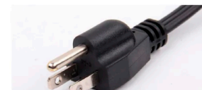
Protección Anti Shock