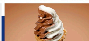
Bomba de aire