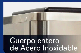
Cuerpo entero de Acero Inoxidable