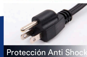
Protección Anti Shock