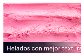
Helados con mejor textura