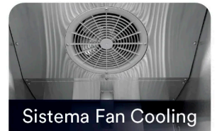
Sistema Fan Cooling