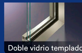
Doble vidrio templado