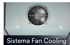
Sistema Fan Cooling