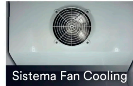
Sistema Fan Cooling