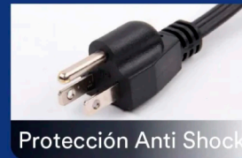
Protección Anti Shock