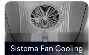
Sistema Fan Cooling