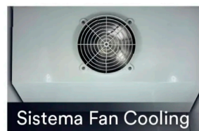
Sistema Fan Cooling