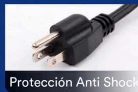
Protección Anti Shock